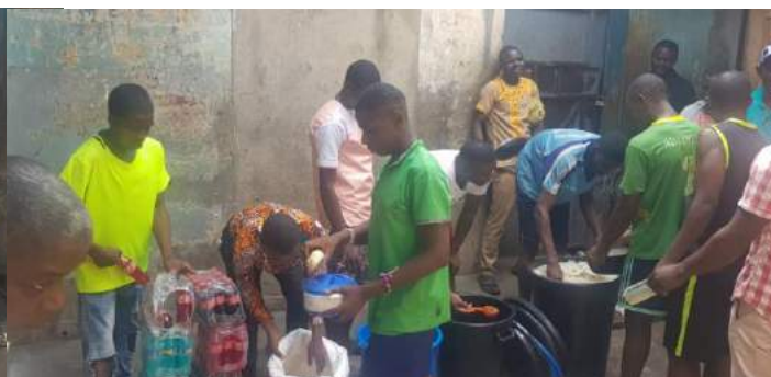
Repas de Noël offert aux jeunes détenus de la Prison Centrale de Yaoundé.