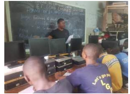
Jeunes détenus en formation de couture, cordonnerie et informatique de la Prison Centrale de Yaoundé.