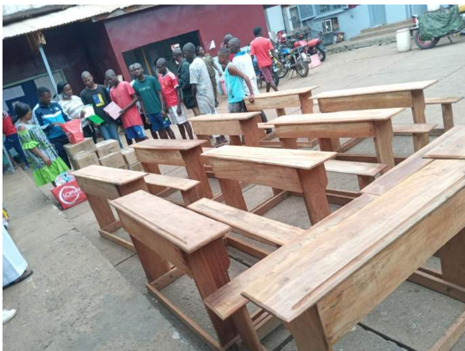
Tables-bancs offerts par l’Ambassade de Suisse à la Prison Centrale de Yaoundé.

Le 8 septembre 2021, EMINED a offert 10 tables-bancs au centre socio-éducatif de la Prison Centrale de Yaoundé.