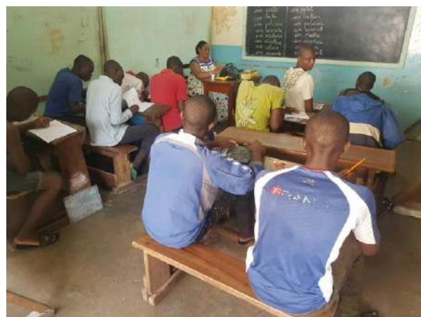
Jeunes détenus en plein cours dans le centre socio-éducatif de la Prison Centrale de Yaoundé.