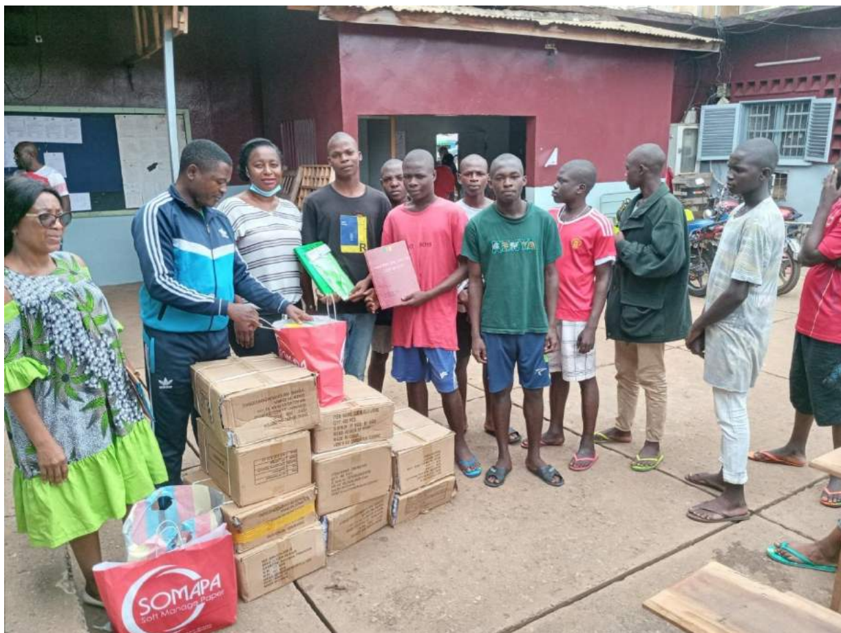
Fournitures scolaires offert par l’Ambassade de Suisse aux mineurs de la prison centrale de Yaoundé.

Des fournitures scolaires et du matériel didactique (des cahiers, crayons, stylos, ardoises, craies, règles, etc.) ont été distribués aux mineurs de la Prison Centrale de Yaoundé pour le compte de la rentrée scolaire 2021-2022.