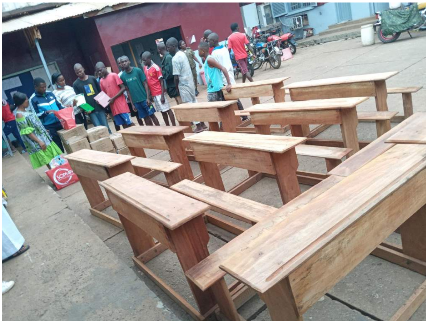
Fournitures scolaires et tables bancs offerts à la Prison Centrale de Yaoundé.

Matériel de formation en couture, informatique et cordonnerie offert à la Prison Centrale de Yaoundé.