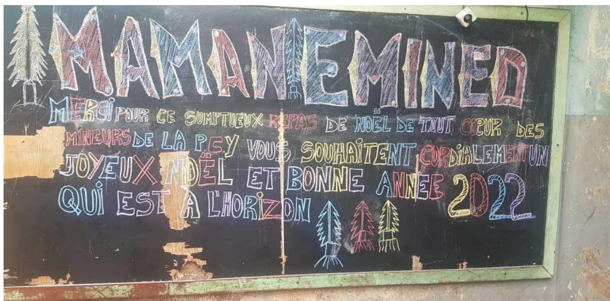
L'affiche d'accueil et de remerciement des jeunes détenus de la Prison Centrale de Yaoundé le 24 décembre.

En conclusion, pour l'année 2021, sur les 41 dossiers ouverts, 18 mineurs ont été définitivement jugés, condamnés et libérés, dont 1 après paiement des amendes par EMINED, 15 purgent encore leur peine et 8 restent en cours de jugement. Parmi les 14 dossiers restants en 2020, 6 ont été libérés, 8 purgent encore leur peine.